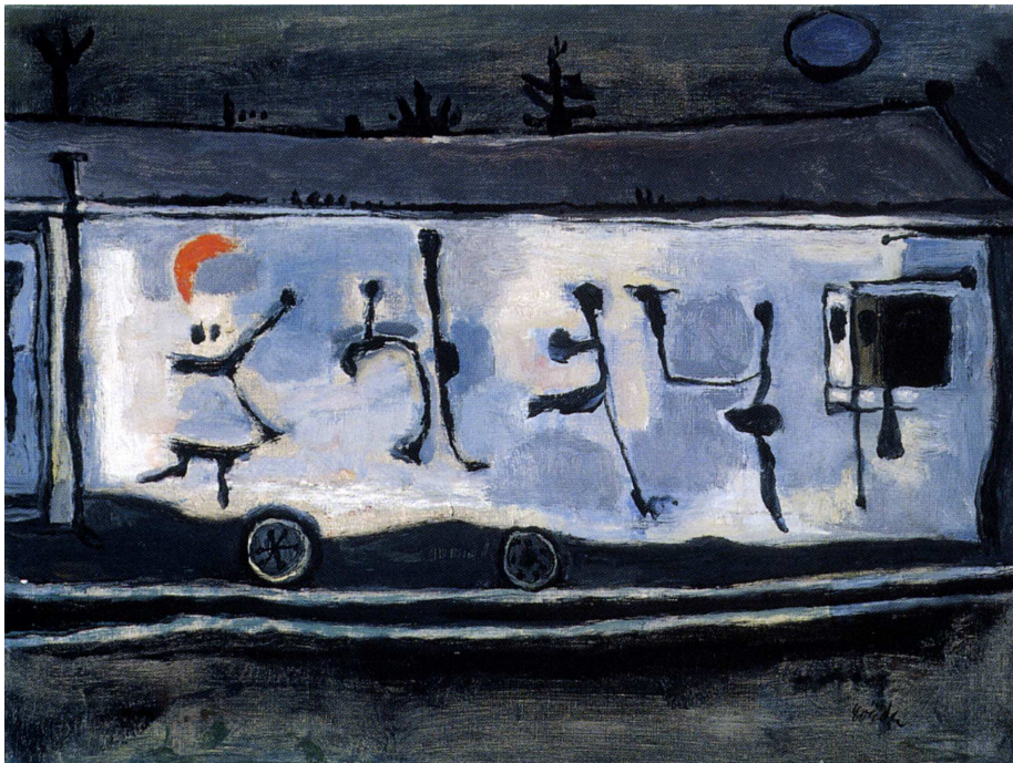
compositie met treintje (1952)