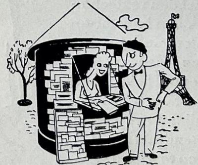
In Parijs: „La semaine à Paris”