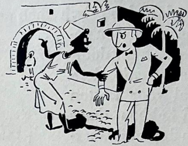
In Port Saïd wijst hij U de weg