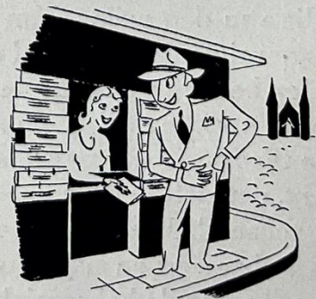
En hiér koopt U .... „DEZE WEEK in Den Haag”